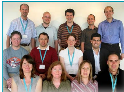
Membres de l'équipe LIPS