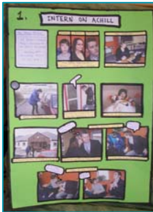
Photo story pour travailler avec clef situations