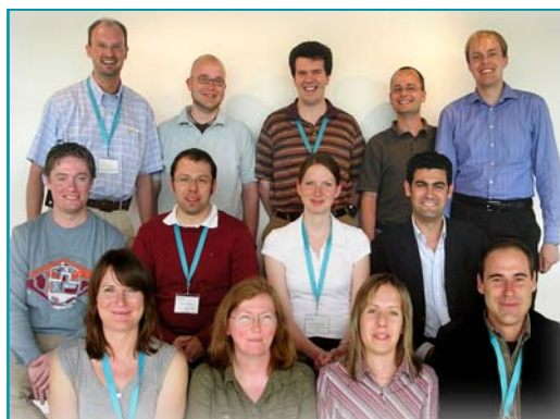
Membri della squadra LIPS project